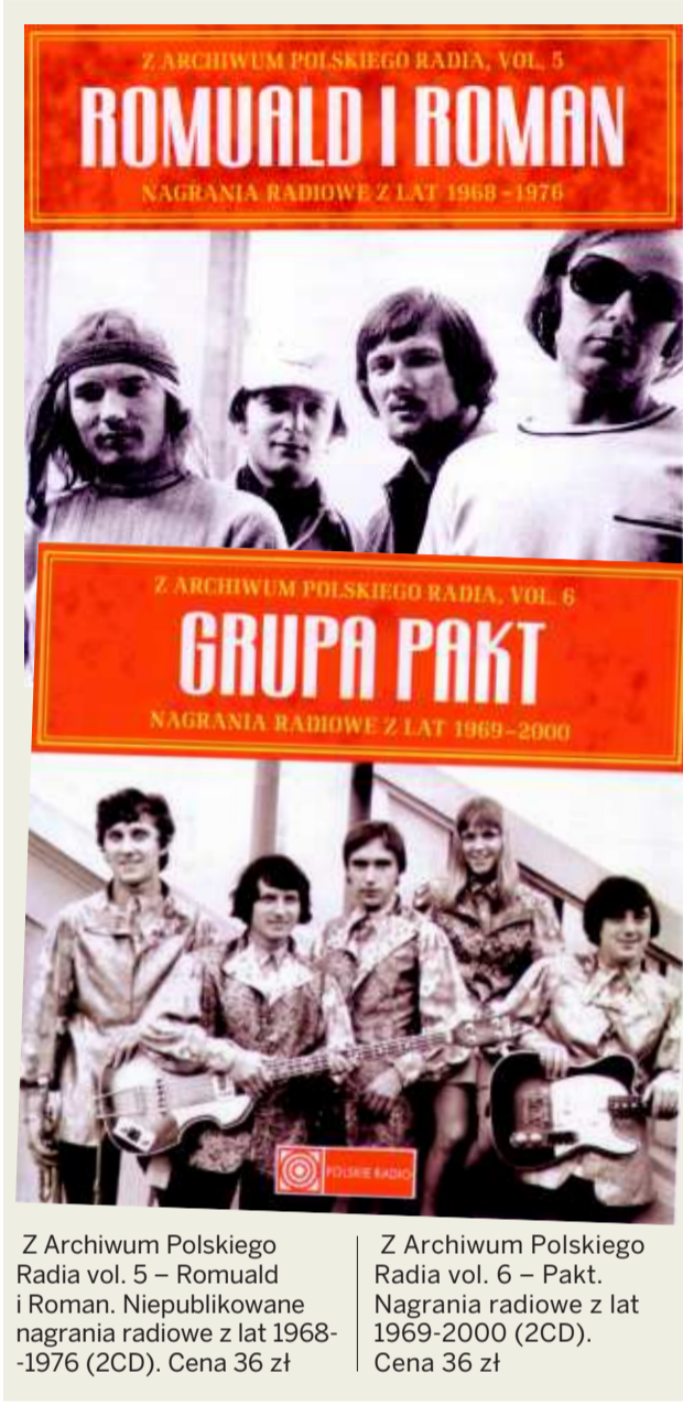
Z Archiwum Polskiego Radia vol. 5 – Romuald i Roman. Niepublikowane nagrania radiowe z lat 1968-1976 (2CD). Cena 36 zł