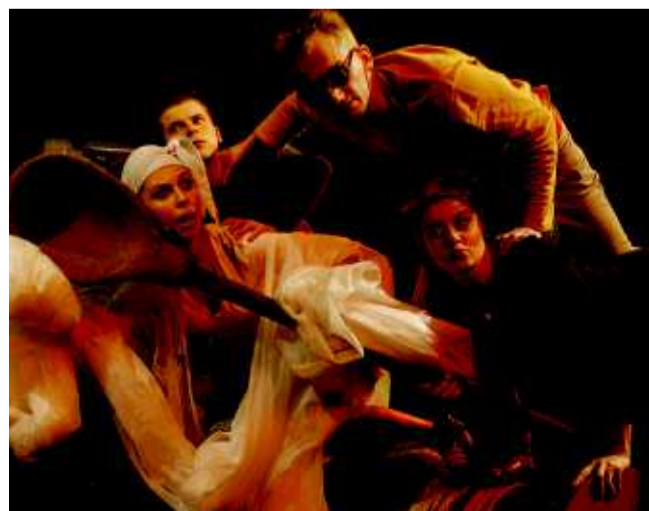
„Momo” to kolejna udana premiera studentów PWST

Teatr PWST, ul. Braniborska 59, od dziś do piątku, a potem aż do 15 lutego „Momo” można oglądać o godz. 10. Rezerwacje biletów – tel. 071-373-58-94.